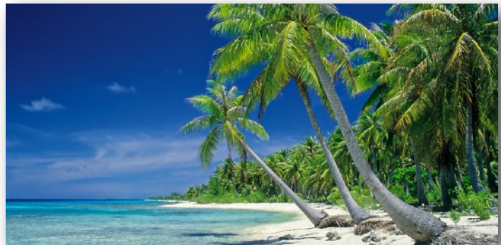
TRAUMINSELN gibt es tatsächlich ...