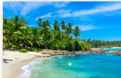
Endlose Palmenstrände ...