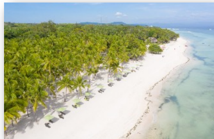
UNTER PALMEN TRÄUMEN...