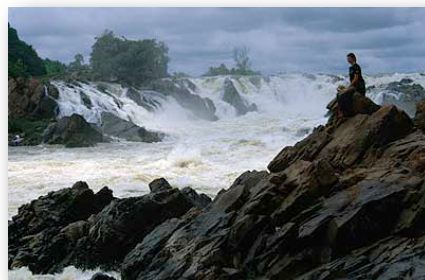
SÜDLAOS, eine Entdeckung wert